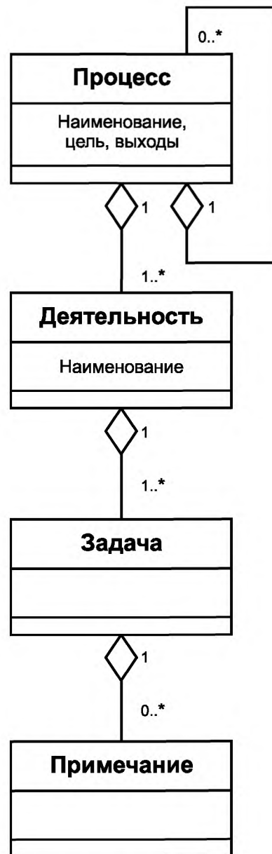
Рисунок С.1 — Конструкции процессов в ИСО/МЭК 12207 и ИСО/МЭК 15288

Примечания используются, если появляется необходимость в поясняющей информации для лучшего описания содержания или структуры процесса. Примечания обеспечивают понимание, относящееся к реализации или области применимости, такой как списки, примеры и другие представления